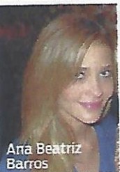
Ana Beatriz Barros